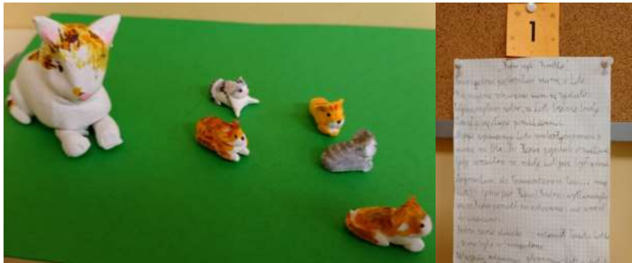
Konkurs plastyczno- literacki „Kot jak malowany”