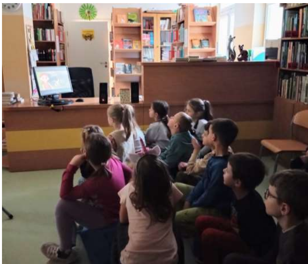
Lekcja biblioteczna na temat kotów w kulturze i literaturze