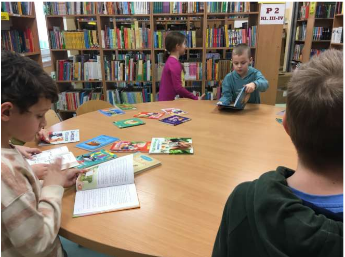
Wypożyczenie książek o kotach