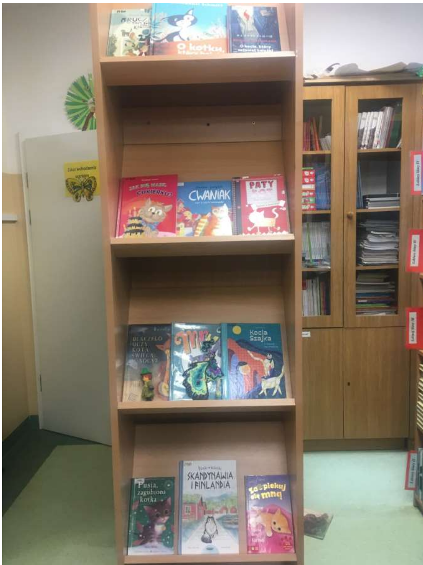
Wystawa książek o kotach