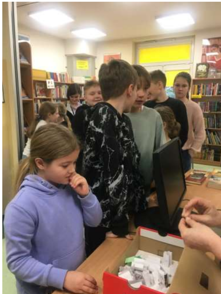
Quiz z „kociej wiedzy”